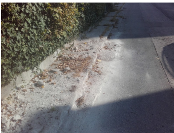
Vergessener Schotter, Unterreing.72

Die betroffenen Penzinger Bürger ärgern sich über die von den Baufahrzeugen hinterlassenen Schäden. Die verursachende Firma hat die Straßen und Gehsteige instand zu setzen, ohne finanzielle Belastung der Bürger.