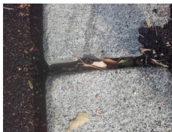
Nicht gefüllte Spalten zwischen Randsteinen, Heinrich-Collinstr.#Zettelweg