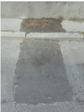
Von Baufahrzeugen zerstörte Gehsteigkanten, z.B.: Ecke Sambeckgasse 26