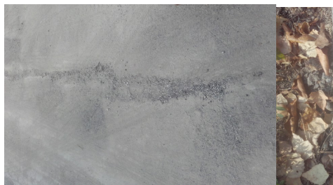
Schotter auf Fahrbahn Heinrich Collin Straße