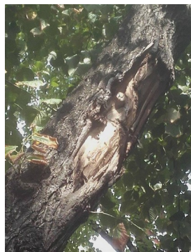
Angefahrener grosser Ast, Hütteldorferstr.190