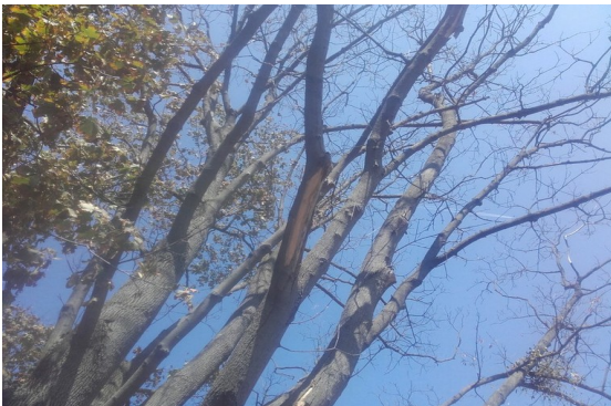
Grosse, abgestorbene Äste über Gehsteig, Platz vor Hanusch KH

Nicht nur bei ein paar Bäumen im Park vor dem Hanusch KH (Heinrich-Collin Str. straßenseitig) hängen große, abgestorbene Äste über den Gehsteig, auch andernorts in Penzing stehen z.T. abgestorbene Bäume entlang von Gehsteigen sowie Straßen und stellen damit eine Gefahr für Fußgänger und andere Verkehrsteilnehmer dar. Eine Kontrolle aller Bäume die an Gehwegen bzw. Straßen sind ist daher dringend nötig.